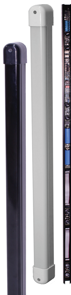
SADRIN WSI SMA